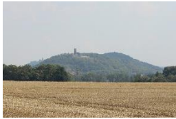
Burgruine Gleichen Wandersleben