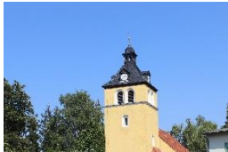
St. Johannis-Kirche Neudietendorf