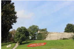
Zitadelle Petersberg Erfurt