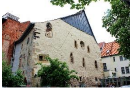
Alte Synagoge Erfurt