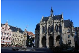
Rathaus & Fischmarkt Erfurt