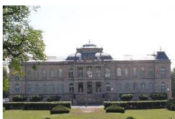
Herzogliches Museum Gotha