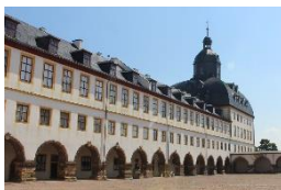
Schloss Friedenstein Gotha