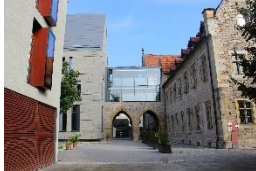
Evang. Augustinerkloster Erfurt