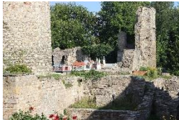
Schlossruine Neideck Arnstadt