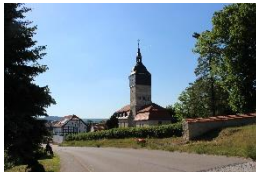
St. Peter & Paul-K. Niederwillingen