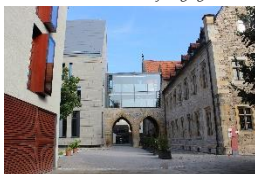
Evang. Augustinerkloster Erfurt