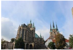
Dom St. Marien & St. Severi Erfurt