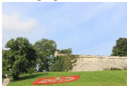
Zitadelle Petersberg Erfurt