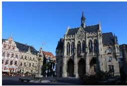
Rathaus & Fischmarkt Erfurt

orientieren Sie sich, entlang der Wegweiser, vorbei an Hausen nach Angelhausen-Oberndorf. Die Straße Am Vorwerk leitet Sie in den Ort. Biegen Sie zwei Mal rechts, zunächst auf die Burggasse und anschließend auf die Angelhäuser Straße, ab. Diese führt Sie in das Stadtzentrum von Arnstadt. Folgen Sie hier der Stadtilmer Straße entlang der Wegweiser des Geraradweges. Sie gelangen nach Ichtershausen. Beachten Sie am Ortsausgang bitte die Hinweise oder eventuelle Umleitungen des Geraradweges nach Molsdorf. Vorbei am Schloss Molsdorf führen Sie die Wegweiser durch Möbisburg, Bischleben und Hochheim zurück in das Altstadtzentrum von Thüringens Landeshauptstadt Erfurt.