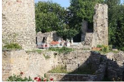
Schlossruine Neideck Arnstadt