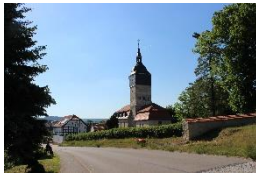
St. Peter & Paul-K. Niederwillingen